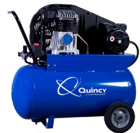
Modelo Q12120PQ Motor 2 HP Tanque 20 Galones