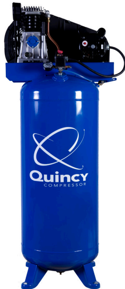
Model Q13160VQ 3.5 HP Motor 60 Gallon Tank