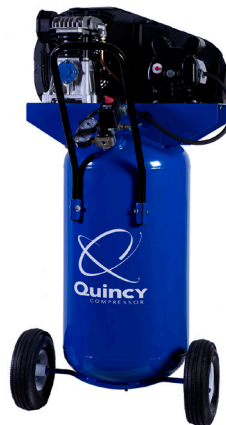
Modelo Q12126VPQ Motor 2 HP Tanque 26 Galones