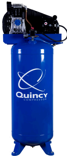
Modelo Q13160VQ Motor 3.5 HP Tanque 60 Galones